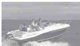
Cap Camarat 625 WA