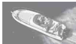
Cap Camarat 755 WA