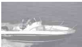
Cap Camarat 545 WA