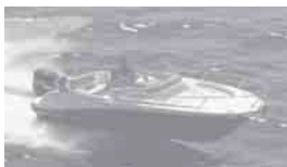
Cap Camarat 715 WA