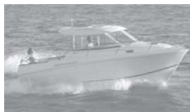
Merry Fisher 705