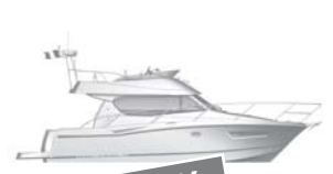
Merry Fisher 10