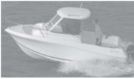
Merry Fisher 585 marlin