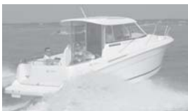
Merry Fisher 655