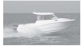
Merry Fisher 725