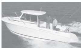
Merry Fisher 655 marlin