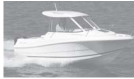
Merry Fisher 585